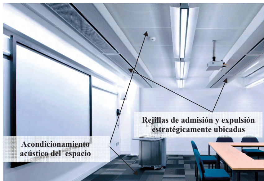
Figura 1. Aula docente climatizada siguiendo las directrices básicas de confort acústico en su interior

La presente guía recoge los problemas sonoros potenciales que se derivan del funcionamiento de una instalación de climatización, así como las medidas antiruido más extendidas. A su vez, se plantean y resuelven diversos casos prácticos, en los que se analiza la problemática de instalaciones reales y se realizan los cálculos necesarios para establecer la idoneidad acústica en cada una de ellas.